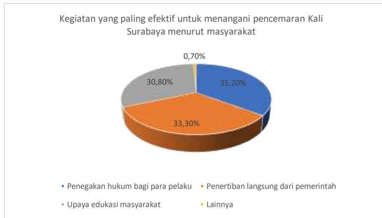
Gambar 2. Kegiatan yang Paling Efektif untuk menangani Pencemaran Kali Surabaya menurut Masyarakat