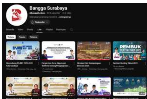
Gambar 2. Tampilan thumbnail YouTube live Bangga Surabaya

Keragaman isyarat merujuk pada cara menyampaikan pesan menggunakan kombinasi elemen verbal dan non-verbal, seperti ekspresi wajah dan gerakan tubuh (Maharani & Djuwita, 2020). Dalam konteks live streaming, pesan disampaikan tidak hanya melalui kata-kata, tetapi juga diperkuat oleh elemen non-verbal seperti ekspresi wajah, gerakan tubuh, serta penggunaan visual seperti grafik, animasi, dan slide. Penggabungan semua elemen ini menghasilkan komunikasi yang lebih dinamis, yang memudahkan audiens untuk memahami dan merespons informasi yang diberikan. " Visual itu kayak thumbnail gitu ya mas, ya iya itu kita bisa pakai thumbnail yang menarik lah bisa juga pakai infografis animasi terus slide presentasi itu kita kasih animasi animasi gitu biar menarik lah untuk audience. "