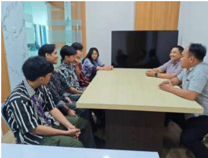
Gambar 3. Koordinasi antar tim dengan menggunakan bahasa yang santai

Variasi Bahasa ( Language Variety ) merujuk pada penggunaan berbagai gaya bahasa yang disesuaikan dengan audiens dan konteks acara untuk memastikan bahwa pesan yang disampaikan dapat dipahami dengan jelas dan efektif (Venus & Munggaran, 2017). Dalam live streaming yang dilakukan oleh Diskominfo Kota Surabaya, variasi bahasa diterapkan dengan menggunakan bahasa formal untuk acara resmi dan bahasa informal atau daerah untuk acara yang lebih santai atau edukatif. Pendekatan ini memungkinkan pemerintah Kota Surabaya untuk menjangkau berbagai kalangan masyarakat dengan cara yang lebih personal dan mudah dipahami.