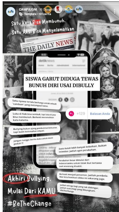
Gambar 2. Poster dan Capture Instagram

Secara konseptual, kampanye “ Stand Your Soul ” tidak hanya menempatkan korban bullying sebagai fokus utama, tetapi juga menyoroti peran lingkungan sosial di sekitarnya. Kampanye ini memosisikan audiens sebagai agent of change yang memiliki tanggung jawab moral untuk turut serta dalam upaya pencegahan