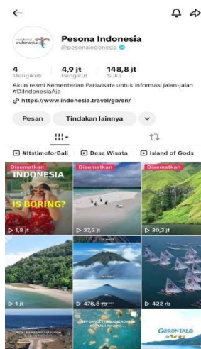
Gambar 1. Akun TikTok @pesonaindonesia

TikTok merupakan salah satu platform media sosial berbasis video pendek yang banyak dimanfaatkan sebagai media komunikasi digital dan promosi pariwisata. Salah satu akun yang aktif menggunakan TikTok sebagai media promosi wisata adalah akun @pesonaindonesia. Akun tersebut secara konsisten mengunggah berbagai konten mengenai destinasi wisata Indonesia kepada masyarakat luas, khususnya pengguna media sosial dari kalangan generasi muda. Konten yang dipublikasikan pada akun @pesonaindonesia umumnya menampilkan keindahan alam, budaya daerah, kuliner khas, hingga berbagai aktivitas wisata dari berbagai wilayah di Indonesia. Video yang