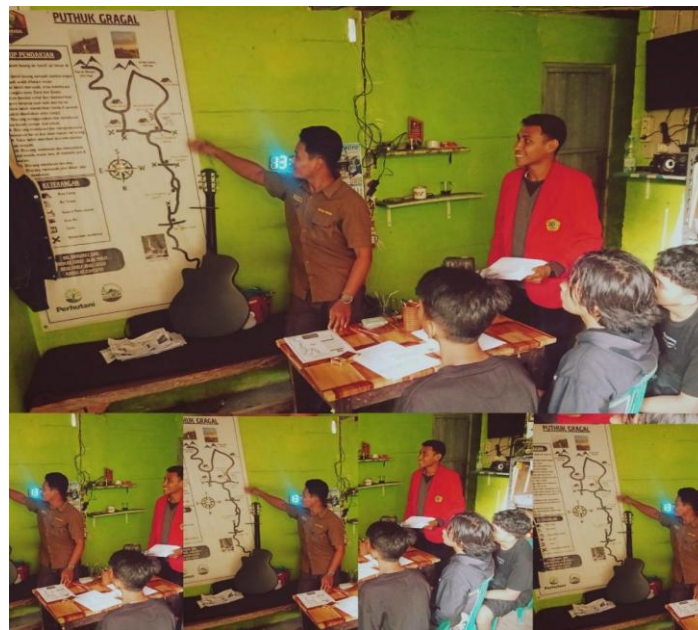
Gambar 1. Kegiatan Sosialisasi dengan tim Pendakian